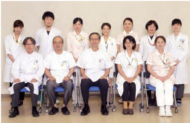
緩和ケアセンタースタッフ

2012年6月に閣議決定された「がん対策推進基本計画」において、重点的に取り組むべき課題の一つとして「がんと診断された時からの緩和ケアの推進」が掲げられました。これを受けて、九州大学病院は都道府県がん診療連携拠点病院として、2015年4月1日、緩和ケアセンターを開設しました。