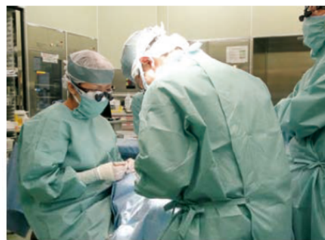
口唇口蓋裂の手術

顎口腔外科： http://www.hosp.kyushu-u.ac.jp/shinryo/dent/07/index.html