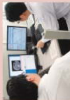
電子カルテを使った医師の診察

が必要だと言われています。九州大学病院にとってカルテの電子化は、その土台作りとも書えるでしょう。