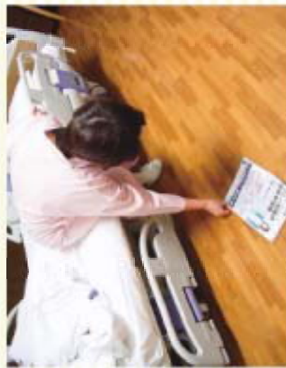
「あー、もうちょっとは看護です」

ゆっくりとした動作、安定した姿勢をとってから動く、体の支えを確保して動く、などをお勧めします。