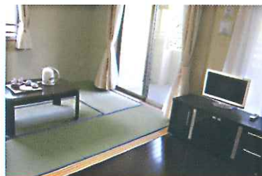
和室タイプ 202号・302号・305号室