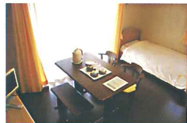
車椅子対応タイプ 203号・205号室