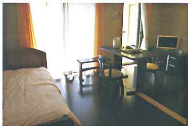
洋室タイプ 301号・303号室