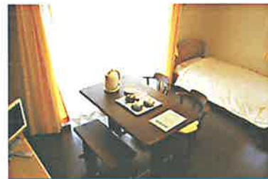
車椅子対応タイプ 203号・205号室