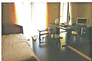
洋室タイプ 301号・303号室