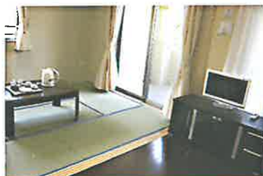
和室タイプ 202号・302号・305号室